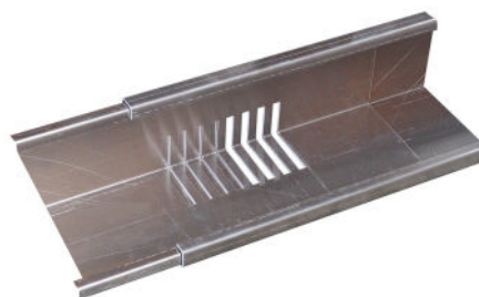
Jonction entre les bordures