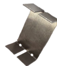
Pièce de jonction