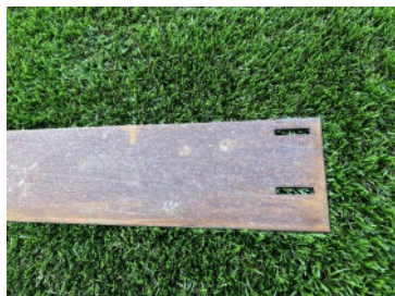
Bordure corten après patinage