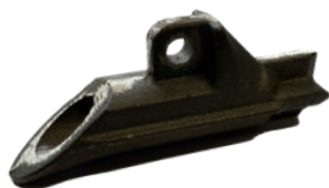
Ancre 88 DB