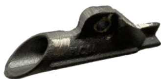
Ancre 68 DB