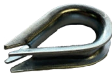
Boucle cosse cœur