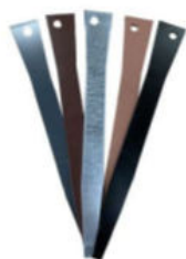
Pieux de fixation 305 mm x 2 mm