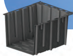
Module de démarrage

Inclus dans le système : Tuyauterie interne, Géotextile, Kit de fixation, Joint d'étanchéité, Système de trop-plein.