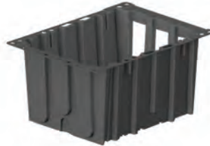
Module de fin