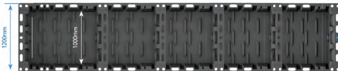
Point de sortie